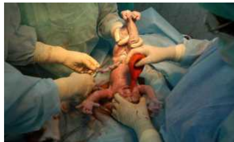
Médicos cortan el cordón umbilical a un bebé que acaba de nacer por cesárea.

Una cirugía mayor ambulatoria a la que solo hay que recurrir cuando se comprueba que el feto no recibe la cantidad de oxígeno necesaria y no ante cualquier complicación en el parto. Esta es la teoría sobre el correcto uso de las cesáreas, pero que no siempre se lleva a la práctica. La Organización Mundial de la Salud (OMS) asegura que un indicativo de un "buen control del embarazo" y de una "correcta asistencia al parto" es que la tasa de cesáreas no supere el 15%, un porcentaje muy por debajo del que registra el